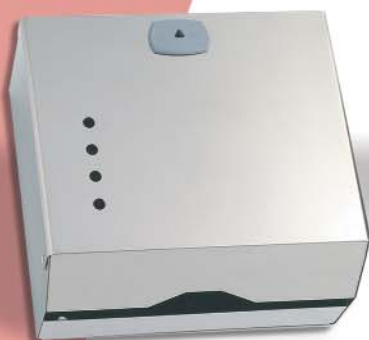
▲ 142/023 Acero Brillo 600 SV