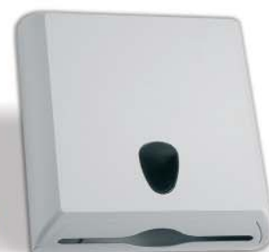
▲ 142/038 Porta Toallas Plástico Blanco