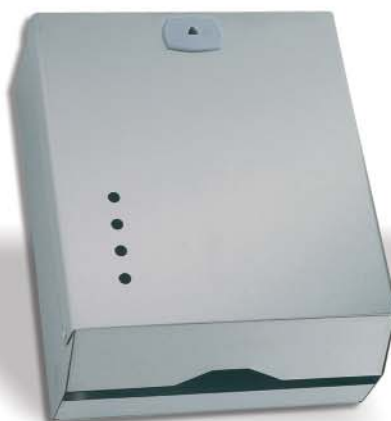
▲ 142/026 Acero Lujo 800 SV