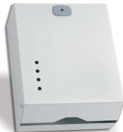
▲ 142/028 Epoxi Blanco 800 SV