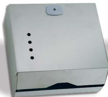
▲ 142/025 Acero Lujo 600 SV