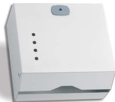
▲ 142/027 Epoxi Blanco 600 SV