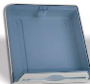
▲ 142/039 Porta Toallas Plástico Fumé

Towel rack of plastic. 2 models: White and fume. Frontal viewfinder of paper level. Lock of security with key.