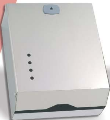
▲ 142/024 Acero Brillo 800 SV